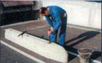
Introduction de la barre d'ancrage