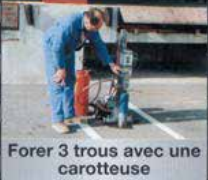
Forer 3 trous avec une carotteuse