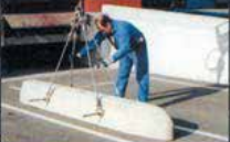
Mise en place