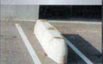
Produit mis en place